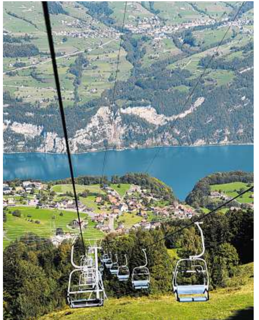
Streikandrohung: Stehen die Bergbahnen in Filzbach wegen der Rentner ab dem 1. Oktober still?

Für Schadegg ist klar, dass seine Existenz und die seiner Mitarbeiterin auf dem Spiel steht. Deswegen werde er dem Druck vorerst nicht nachgeben. Er sei allerdings bereit, im Interesse des Kerenzerbergs eine allfällige Abfindung in Betracht zu ziehen. Dieses Angebot machte Schadegg den Gesellschaftern Anfang September. Bisher habe er jedoch noch keine Antwort erhalten.