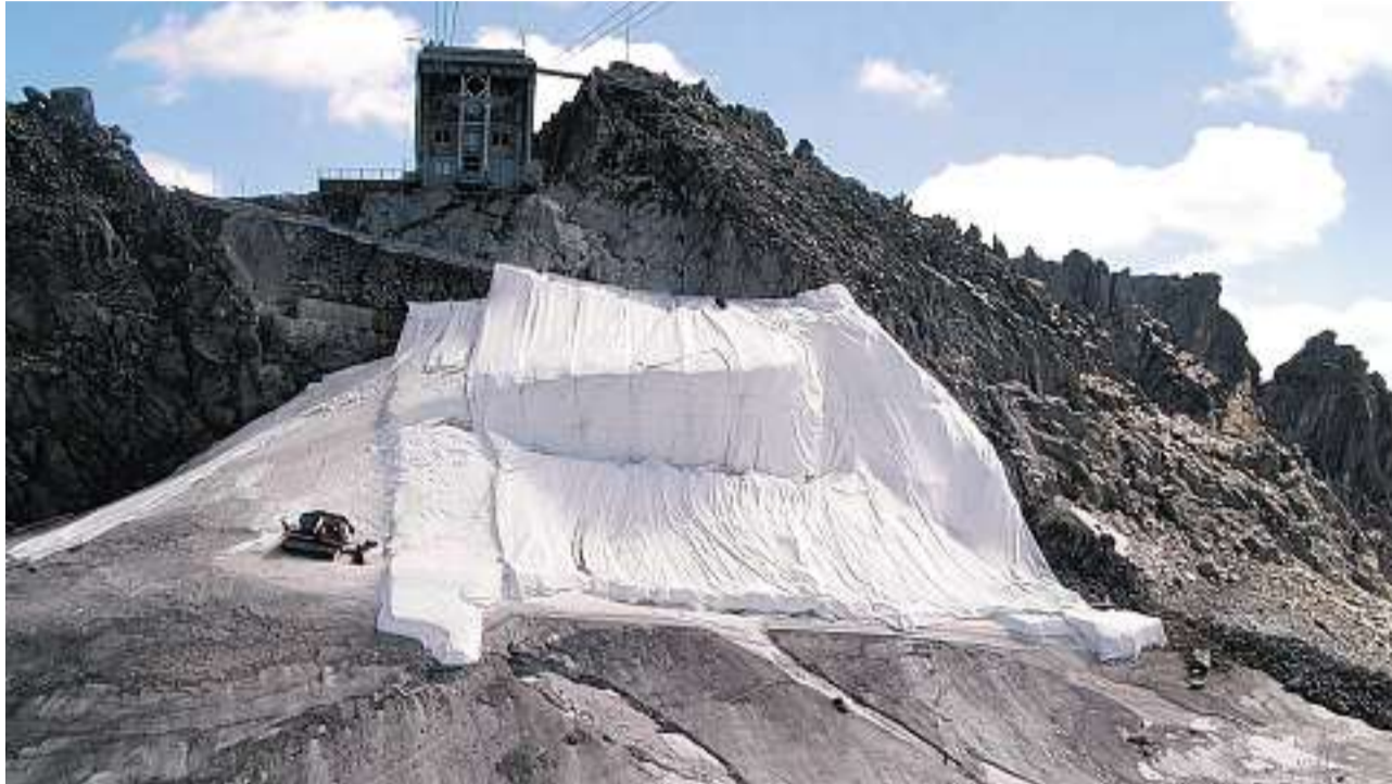
Marge geschmolzen: Gletscher-Vliese der Fritz Landolt AG, wie hier am Gemsstock, kommen künftig aus dem Euroraum.

Die Näfelscher Fritz Landolt AG verlegt die Produktion von Geotextilien in den Euroraum. Die weiteren Sparten in Näfels und in Frankreich sind nicht betroffen. Das Mitwirkungsverfahren, das den Stellenabbau minimieren helfen soll, läuft.