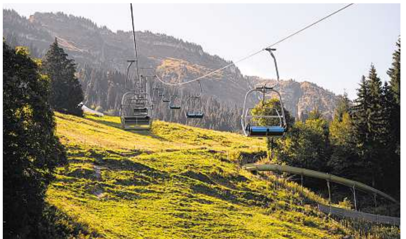
Bereit für den Schnee: Werden am Kerenzerberg schon bald Schlittenhunde herumtollen?

Anstatt die Skifahrer möchte man in Filzbach die Airboarder fördern. Denn diese sind auf den Skipisten nicht gerne gesehen. Trotzdem ist das Skifahren in Filzbach möglich, wenn auch nicht unbedingt vorgesehen. «Die Piste wird extra für die Airboarder gemacht», so Kolb. Wer aber unbedingt möchte, darf auch mit Skis