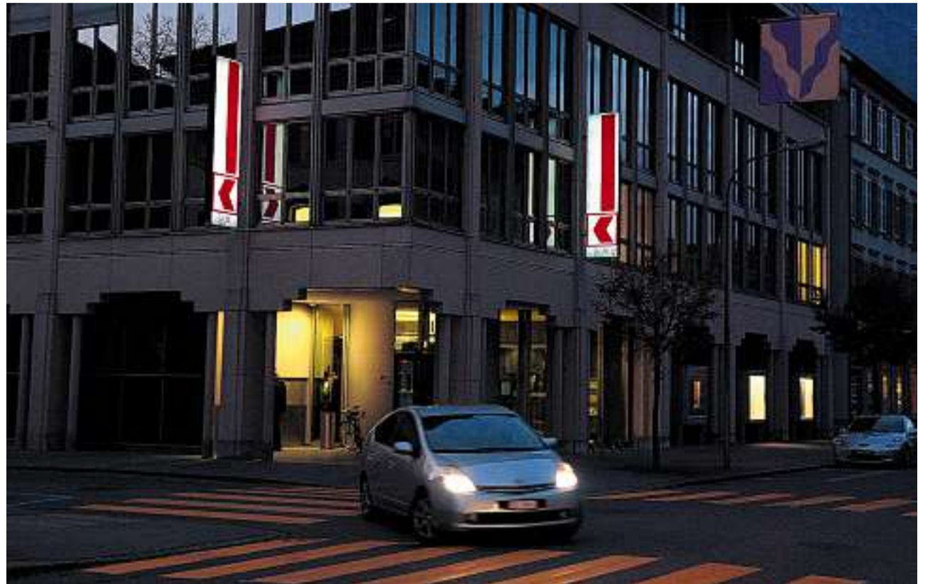
Licht ins Dunkel: Die Glarner Kantonalbank wartet auf die Gerichtsverhandlung gegen frühere Organe.